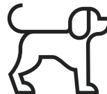
PES MÀXIM 15 KG