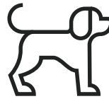
PES MÀXIM 15 KG